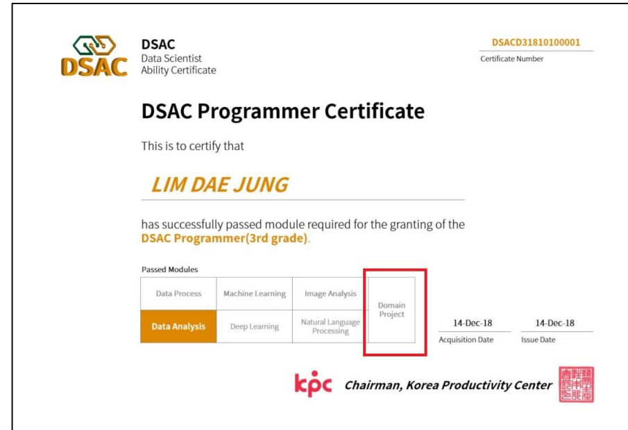
《 자격증 사본 》